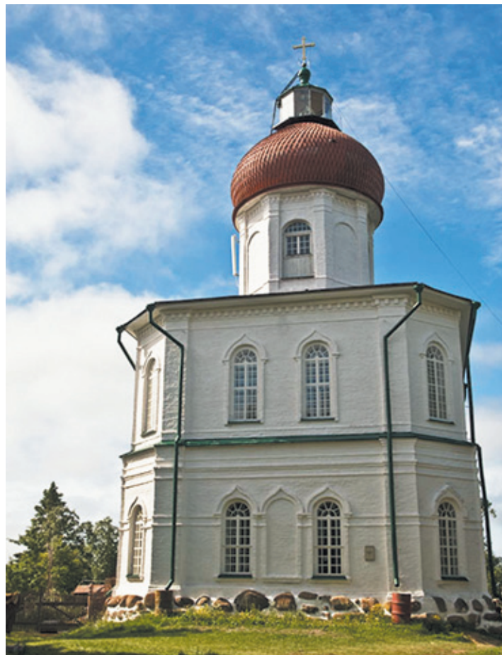
На Соловках должен побывать каждый думающий человек...